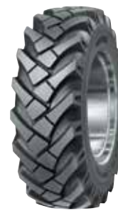
Pneus sur route / tout-terrain