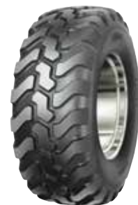
Pneus sur route / tout-terrain / industriels